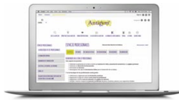
Acceso al espacio reservado a profesionales Antigimnasia®