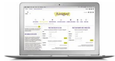
Su propia tarjeta de visita on line