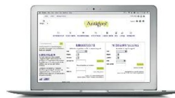
Référencement dans l'outil de recherche de praticiens du site