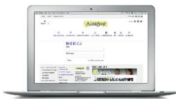
Accès à l'espace réservé aux praticiens certifiés Antigymnastique®