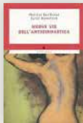
Nuove vie dell'Antiginnastica® Thérèse Bertherat in collaborazione con Carol Bernstein, Mondadori, 1981