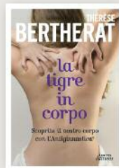
La tigre in corpo Thérèse Bertherat Mondadori, 1990, Lexitis 2013