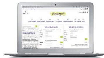
Spazio riservato agli esperti certificati Antiginastica®