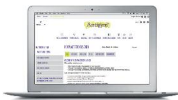
Reservierter Zugang für zertifizierte Kursleiter Antigymnastik