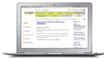
Reservierter Zugang für zertifizierte Kursleiter Antigymnastik